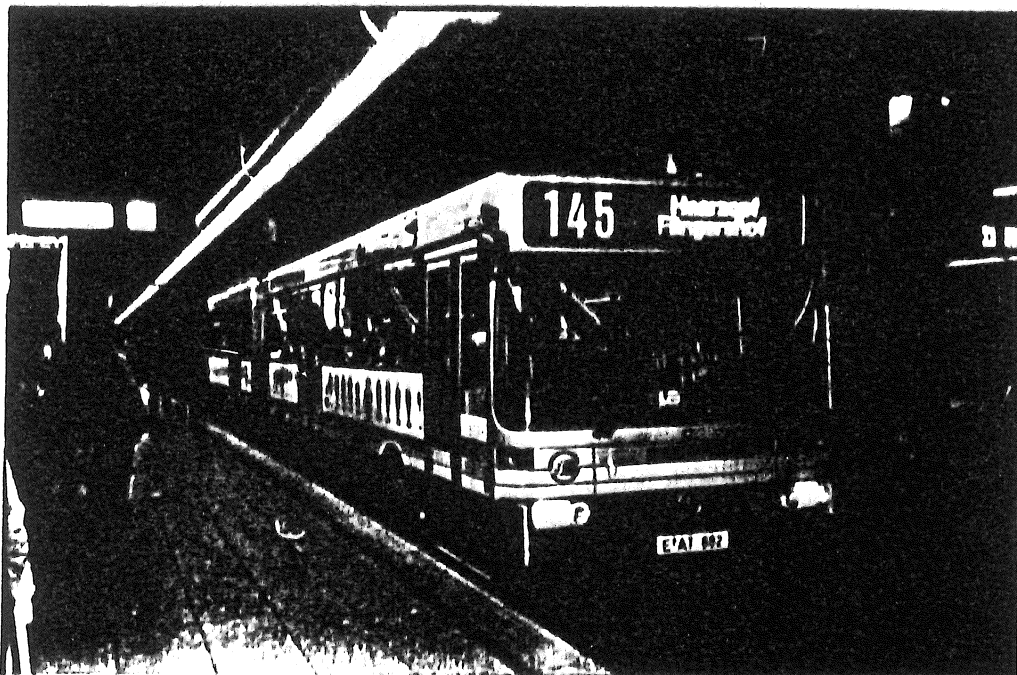
Inzwischen schon zur Gewohnheit geworden: Ein Duo-Bus im U-Bahnhof Porscheplatz auf der Linie 145 (Duo-Bus 3712 am 7.12.1989)